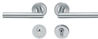
Drücker/Drücker DDGN1 € 42,-