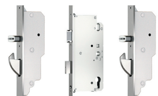
5-Punkt-Automatik € 114,-